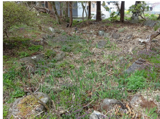
⑦ 中池側から見る下池