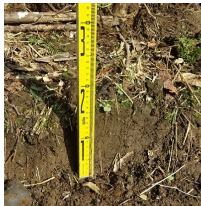
中池の土砂の堆積状況