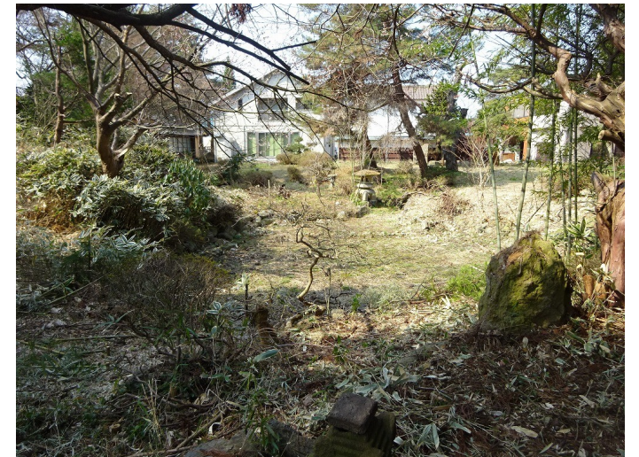
社から見返した庭(中池と庭園、その奥にあった屋敷を望む視点場)