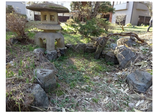
③ 岬の燈籠がありやや滝状になって中池に入る。