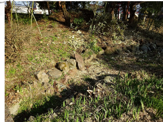
④ 護岸に赤石が見られる