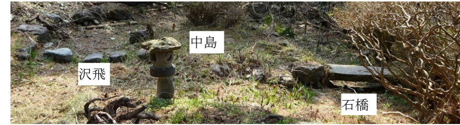
② 上池の中島・沢飛・石橋 下の写真は上池の石組護岸