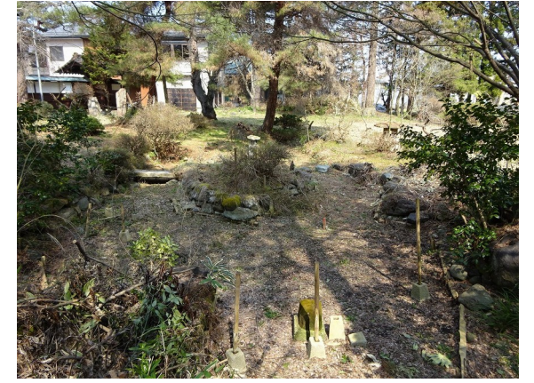
上池を南側から望む