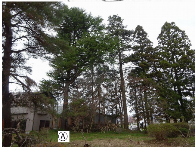
北側の屋敷林 A のヒマラヤスギ