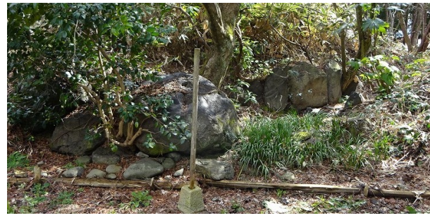
① 水の取り入れ口付近には大型の石が使用されている。