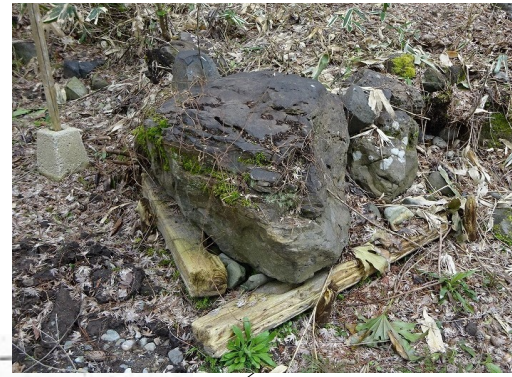
岬の部分に大形の景石を据えている。