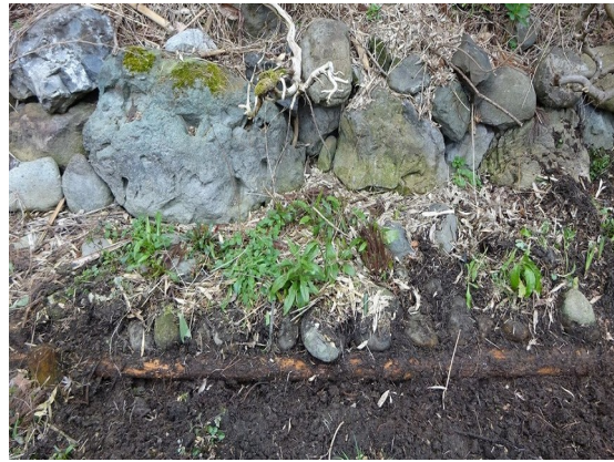
⑥ 中池の石組護岸と周囲に回された桐木